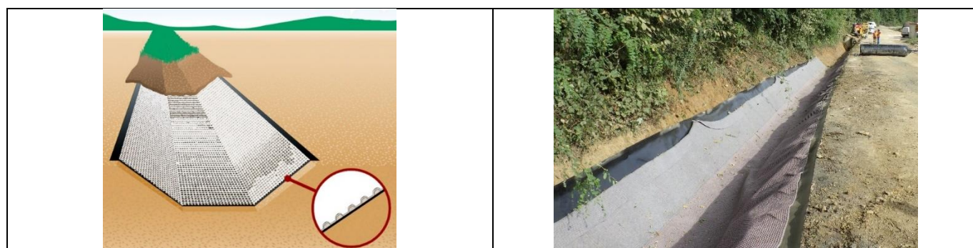
Figure 7. Réalisation des fossés étanches avec le géocomposite étanche alvéolaire

Par ailleurs, les raccordements entre descentes d'eau et fossés ont été particulièrement soignés (Figure 8).