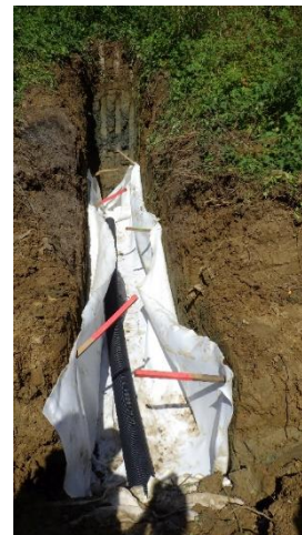
Figures 13. Réalisation de la tranchée drainante en pied de digue et creusement de l'éperon de drainage avec géotextile qui emballle le drain en pied

Des bandes de géocomposite de drainage sont mises en œuvre sur toute la hauteur de la digue, ancrées en tête, puis recouvertes de matériau argileux. Puis une bande de géomembrane en PEHD 2mm est mise en œuvre par dessus, puis surmontée du géocomposite de retenue de terre (dimensionnés selon la norme NFG 38-067), puis de terre végétale (Figure 12).