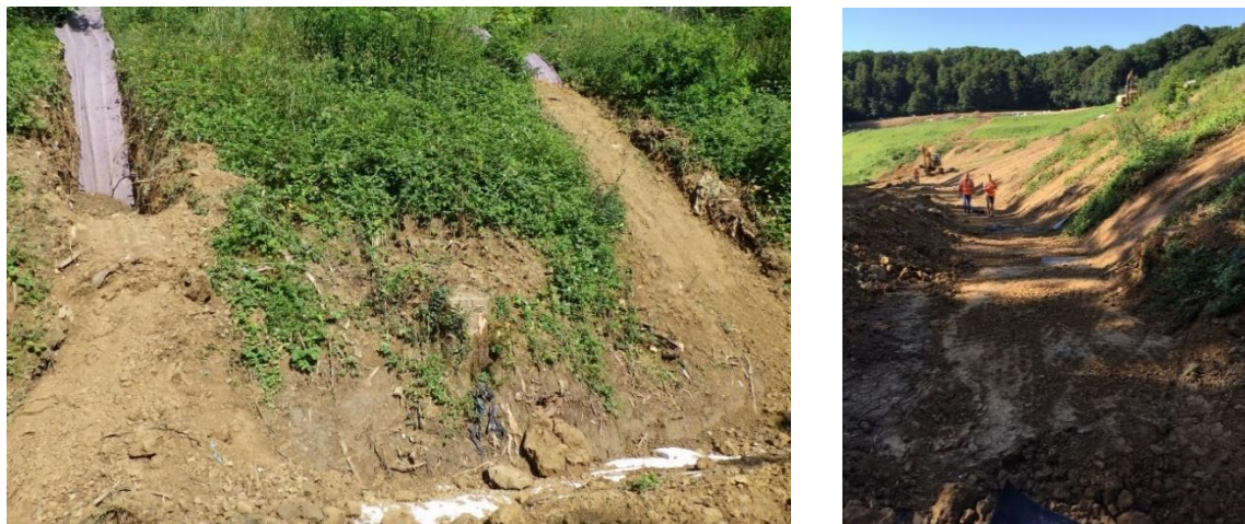
Figure 14. Bandes de géocomposite de drainage, bande de géomembrane et recouvrement