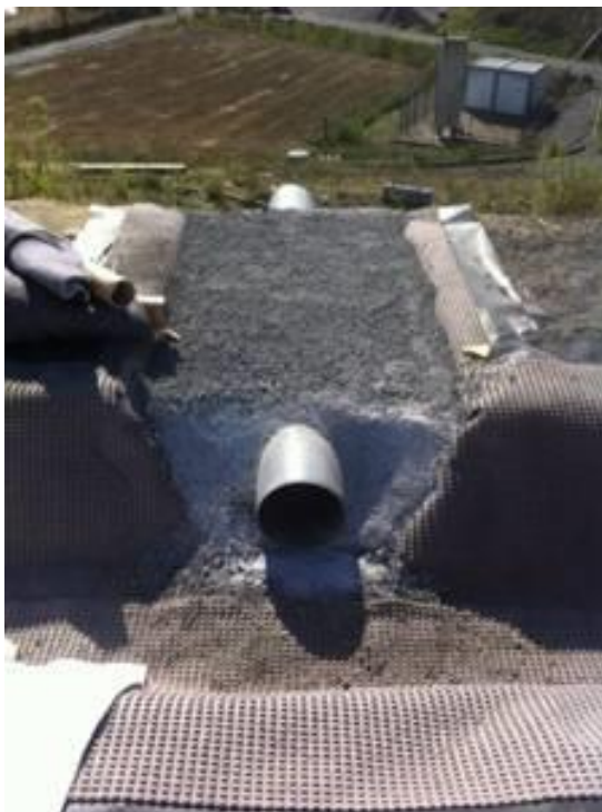
Figure 8. Exemple de raccordement entre un fossé étanché par le géocomposite alvéolaire et une descente d'eau