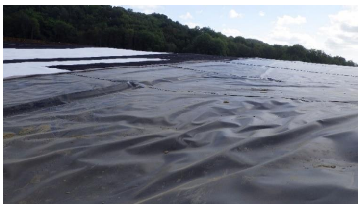
Figure 3. Mise en œuvre de la géomembrane PEHD 2mm en couverture