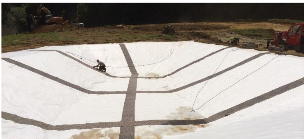
Figure 11. Bassin à lixiviats en cours : géotextile 600 g/m 2 et bandes de drainage des gaz