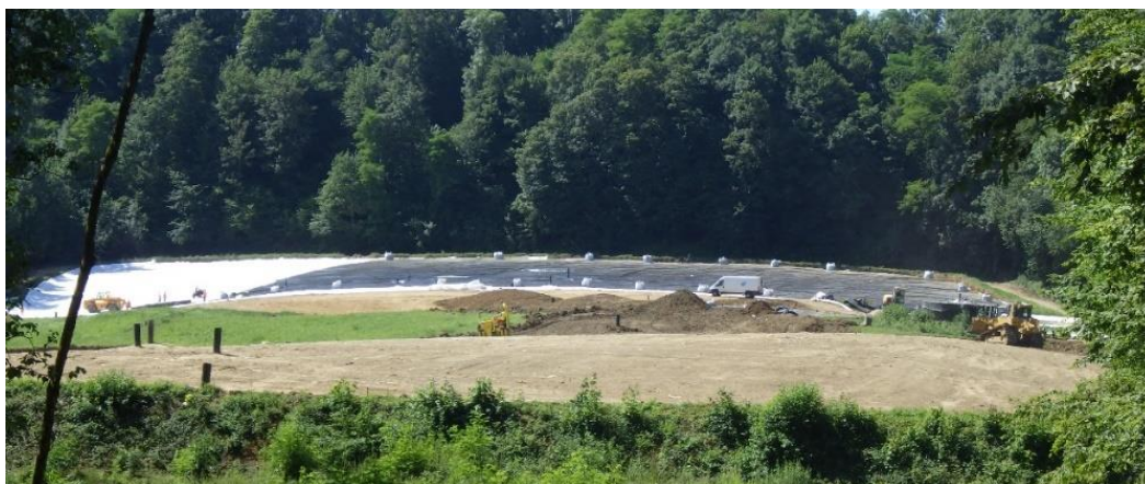
Figure 2. Mise en œuvre des géocomposites composant la couverture (géotextile anti-poinçonnant en blanc, géomembrane PEHD 2mm puis géocomposite de drainage en noir)

Un ensemencement a ensuite été réalisé afin de favoriser le développement d'une végétation maîtrisée (graminées, pelouse, trèfle).