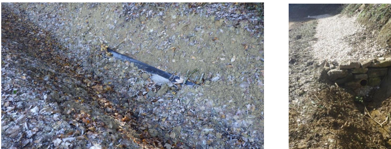
Figure 10. Problème de tenue du géocomposite localement, solution palliative

Localement, au niveau d'un fossé situé au pied du versant boisé amont, des désordres sont apparus : des glissements de la terre de recouvrement et du géocomposite (Figure 10). Il a été décidé de renforcer le nombre d'agrafes et de remblayer le fossé avec un drain routier et du matériau granulaire (Figure 10).