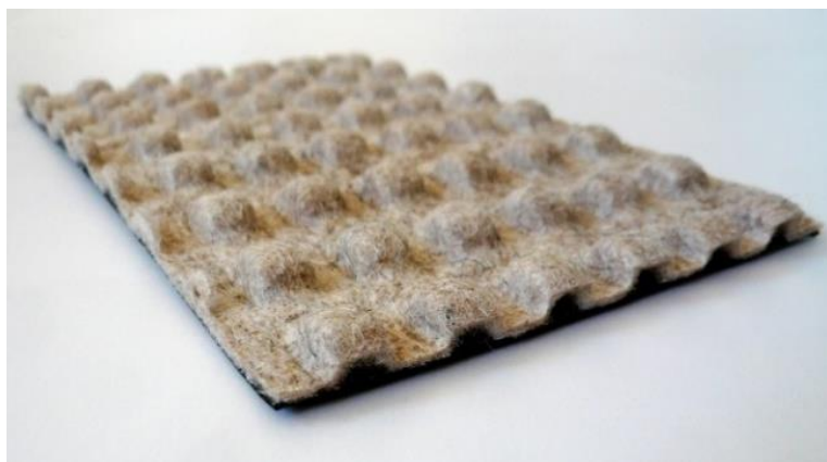
Figure 5. Détail du géocomposite alvéolaire de retenue de terre

Le géocomposite alvéolaire Stabiliner Alvéo est composé d'un géotextile non-tissé aiguilleté thermoformé associé par contre-collage à une géomembrane. Les alvéoles ont pour fonction de retenir la terre mise en œuvre dans le fossé pour des pentes allant jusqu'à 1H/1V (Figure 5). Les fossés sont ensuite remblayés en terre végétale comme le reste de la couverture (Figures 6 et 7).