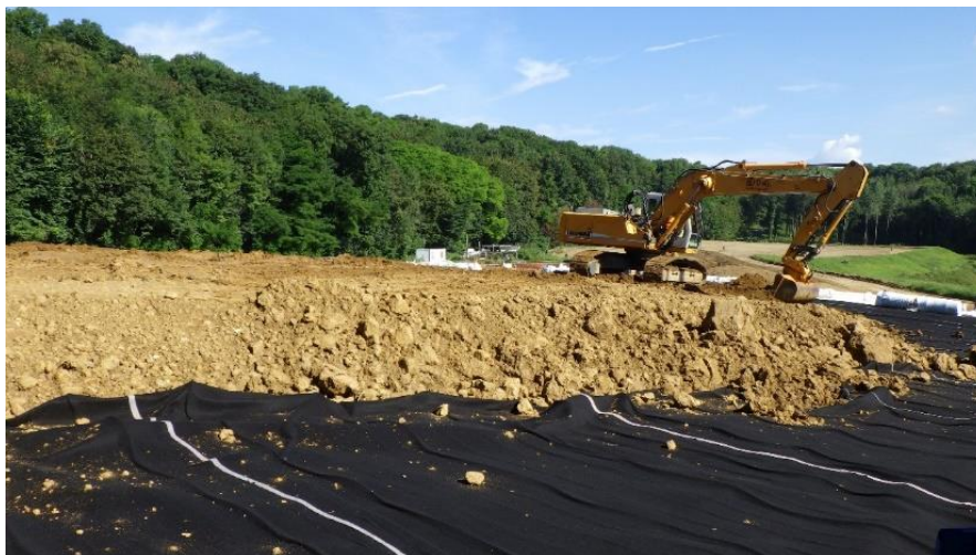
Figure 4. Mise en œuvre de la couche de recouvrement sur le géocomposite de drainage