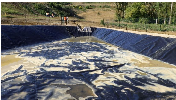
Figure 9. Bassin eau pluviales étanché

L'ensemble des géosynthétiques est ancré en crête dans une tranchée de section 0,50 x 0,50 m, située à plus de 0.5 m de la crête de digue.