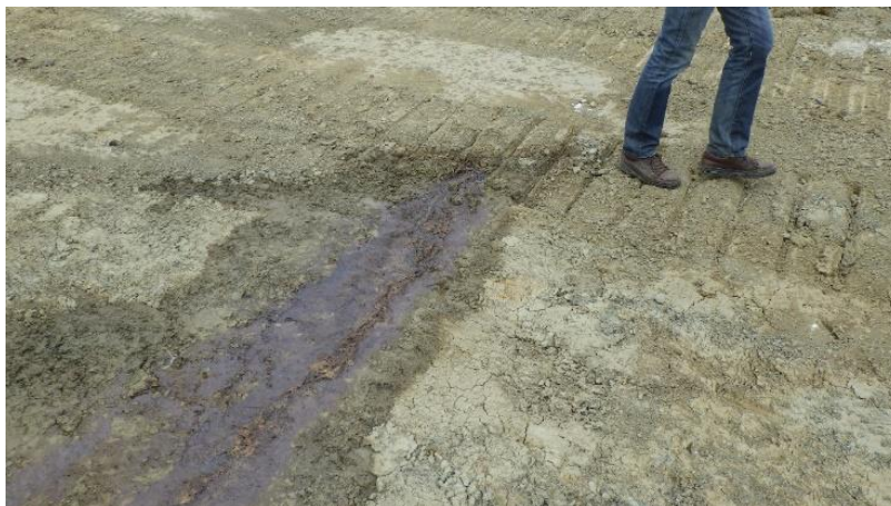
Figure 1. Présence de lixiviats dans le massif de déchets avant mise en place de la couverture

Cette couverture était vraisemblablement dégradée, et/ou présentait des défauts de mise en œuvre, vu les niveaux de lixiviats mesurés dans les puits au sein du massif de déchets (Figure 1).